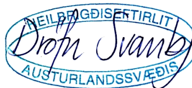
Dröfn Svabjörnsdóttir heilbrigðisfulltrúi